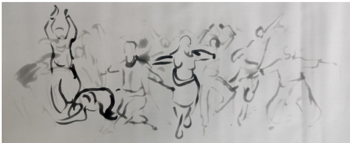
Dessin : Lucile Duchemin, 2022